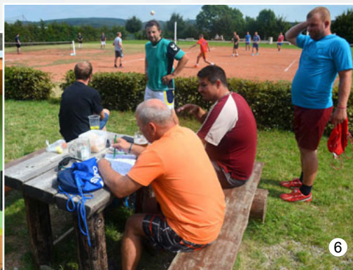
Dozvuky po pouti ve Vavřinci – nohejbal