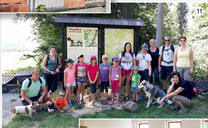
Vycházka do Punkevních jeskyní