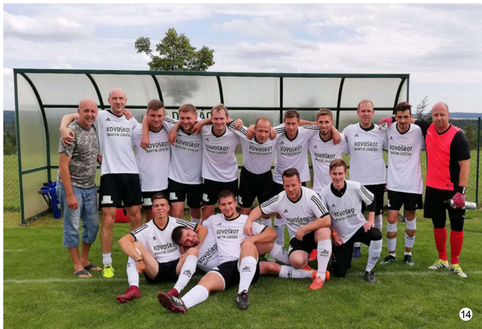
Tým mužů TJ Vavřinec Na titulní straně: Žně u Vavřince

Informační zpravodaj č. 4/2019 Obecního úřadu sloučených obcí Vavřinec – Veselice – Suchdol – Nové Dvory • Reg. MK ČR E 21313 • Vychází pravidelně 1x za 2 měsíce • Toto číslo bylo dáno do tisku 21. 8. 2019 • Adresa redakce: Obú Vavřinec, Vavřinec 92, 679 13 Sloup. t. č. 516435414, e-mail: obec@vavrinec.cz • Za obsahovou a stylistickou stránku textů vydaných ve zpravodaji odpovídá autor • Redakce si vyhrazuje právo příspěvky krátit. Uzávěrka příštího čísla je 21. října 2019 • Sazba a tisk GRAN spol. s r. o. Blansko