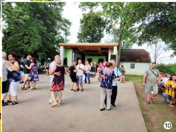
Pouťová zábava v Suchdole