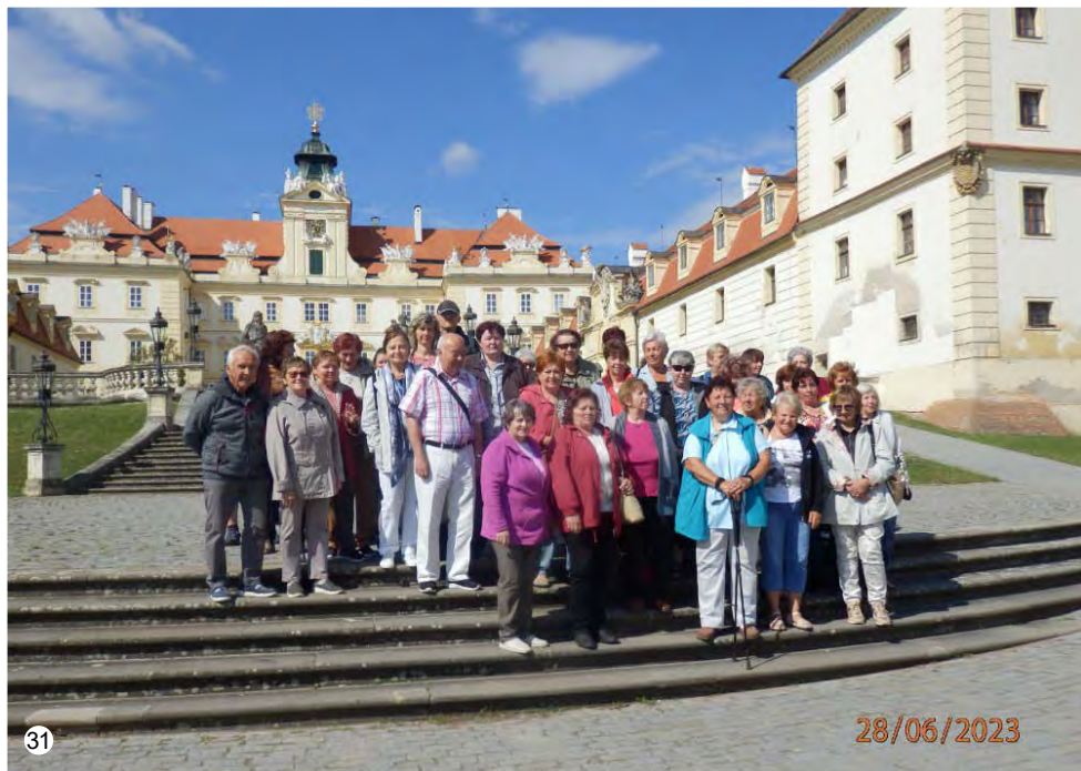
Zájezd svazu tělesně postižených Na titulní straně: Žně u Vavřince

Informační zpravodaj č. 4/2023 Obecního úřadu sloučených obcí Vavřinec – Veselice – Suchdol – Nové Dvory • Reg. MK ČR E 21313 • Vychází pravidelně 1x za 2 měsíce • Toto číslo bylo dáno do tisku 29. 8. 2023 • Adresa redakce: Obú Vavřinec, Vavřinec 92, 679 13 Sloup. t. č. 516435414, e-mail: obec@vavrinec.cz • Za obsahovou a stylistickou stránku textů vydaných ve zpravodaji odpovídá autor • Redakce si vyhrazuje právo příspěvky krátit. Uzávěrka příštího čísla je 18. října 2023 • Sazba Z. Nečas, tisk Reprocentrum, a.s.