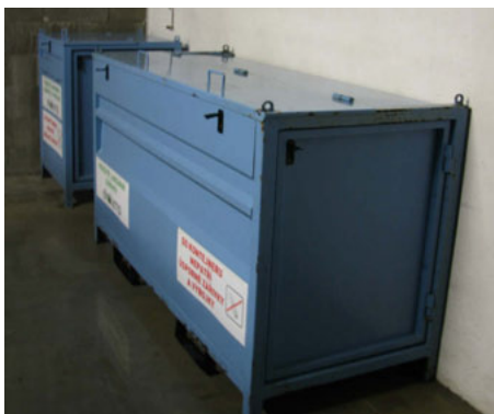
Kontejnery na sběr nefunkčních zářivek ve sběrném dvoře ve Veselici

Obyvatelé naší obce, ale i ze sloupského regionu mohou nefunkční zářivky zdarma odevzdávat ve sběrném dvoře ve Veselici (adresa: Veselice 102, 679 13 Sloup, GPS: 49°23'53.1"N, 16°42'37.3"E) nebo v obchodě při nákupu nových výrobků