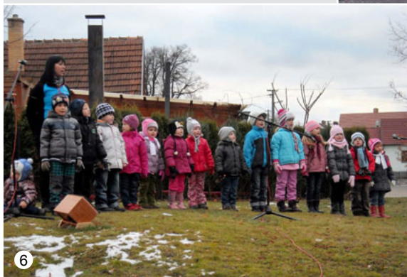
Rozsvěcení vánočního stromu ve Veselici