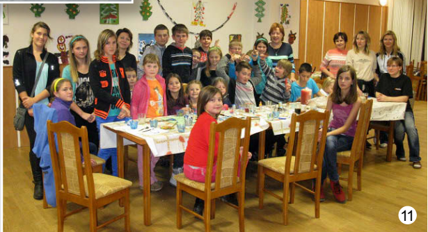
Mikuláš v MŠ Vavřinec