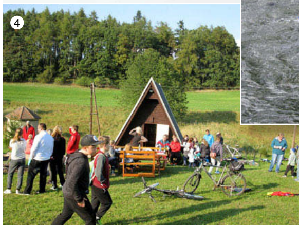
Drakiáda ve Vavřinci