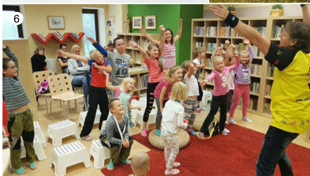
Akce Malované odpoledne ve veselické knihovně