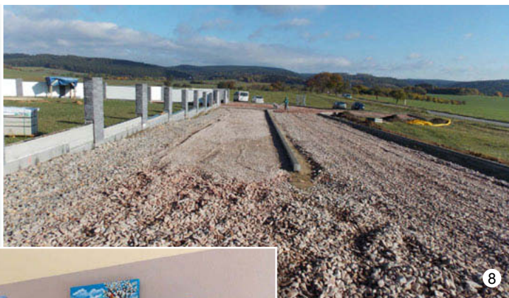
Stavba hřbitova ve Vavřinci