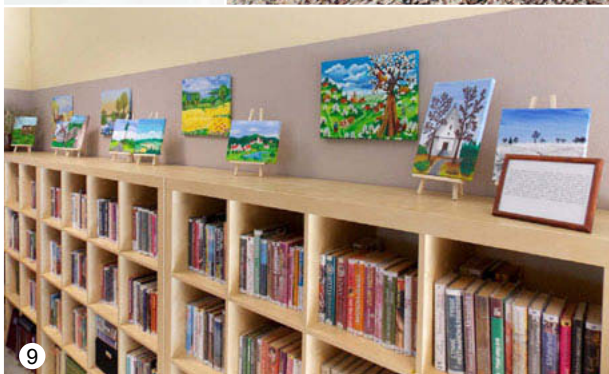
Výstava obrazů ve veselické knihovně