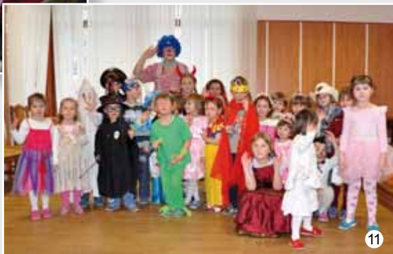
Tvořivá dílna ve Veselici