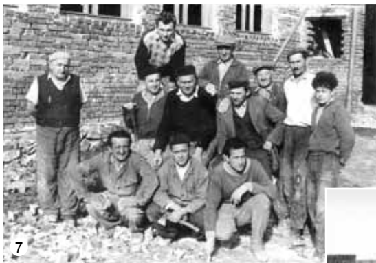
Stavba KD Veselice (1955–1964)