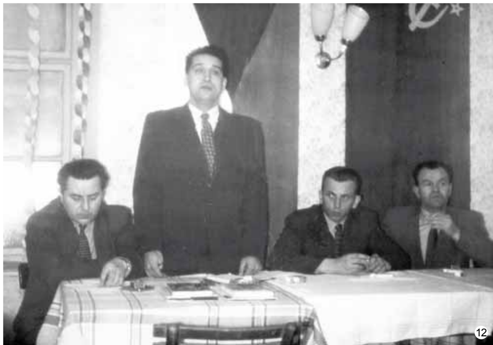
Ustavující schůze MNV Vavřinec v roce 1960

Informační zpravodaj č. 2/2010 Obecního úřadu sloučených obcí Vavřinec – Veselice – Suchdol – Nové Dvory • Vychází pravidelně 1x za 2 měsíce • Toto číslo bylo dáno do tisku 23. 4. 2010 • Adresa redakce: Obú Vavřinec, Vavřinec 92, 679 13 Sloup. t. č. 516435414, e-mail: obec@vavrinec.cz • Za obsahovou a stylistickou stránku textů vydaných ve zpravodaji odpovídá autor • Redakce se vyhrazuje právo příspěvky krátit Uzávěrka příštího čísla je 21. června 2010 • Sazba a tisk GRAN spol. s r. o. Blansko Autoři fotografií: Ditrich Vladimír (10) • Hájek Josef (4) • Hájková Olga (2) • Kakáč Jan (9,10,12) • Novotný Miloslav (1,3,5,6) • Sedlák Evžen (7) • neznámý (8)