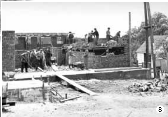
Stavba obchodu v Suchdole (1974–1975)