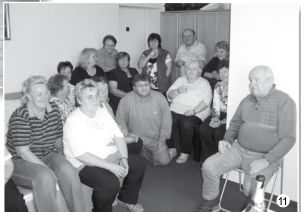
Zakončení školních prázdnin ve Veselici