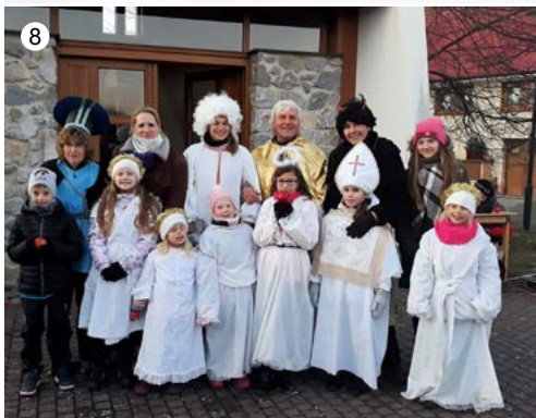
Rozsvěcování vánočního stromu ve Veselici