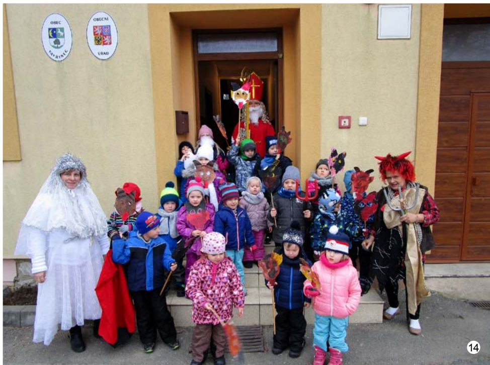
Mikuláš na obecním úřadě. Na titulní straně: Vánoční strom ve Vavřinci

Informační zpravodaj č. 6/2019 Obecního úřadu sloučených obcí Vavřinec – Veselice – Suchdol – Nové Dvory • Reg. MK ČR E 21313 • Vychází pravidelně 1x za 2 měsíce • Toto číslo bylo dáno do tisku 18. 12. 2019 • Adresa redakce: Obú Vavřinec, Vavřinec 92, 679 13 Sloup. t. č. 516435414, e-mail: obec@vavrinec.cz • Za obsahovou a stylistickou stránku textů vydaných ve zpravodaji odpovídá autor • Redakce si vyhrazuje právo příspěvky krátit. Uzávěrka příštího čísla je 19. února 2020 • Sazba a tisk GRAN spol. s r. o. Blansko