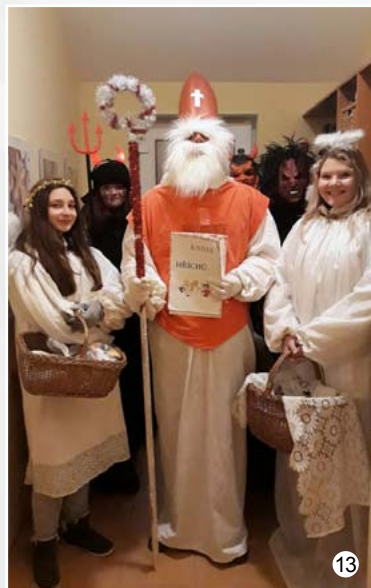
Mikuláš s anděly a čerty ve Veselici