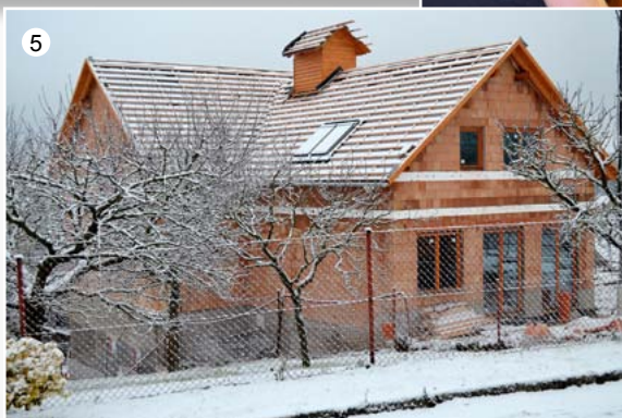
Stavba víceúčelové budovy v Suchdole