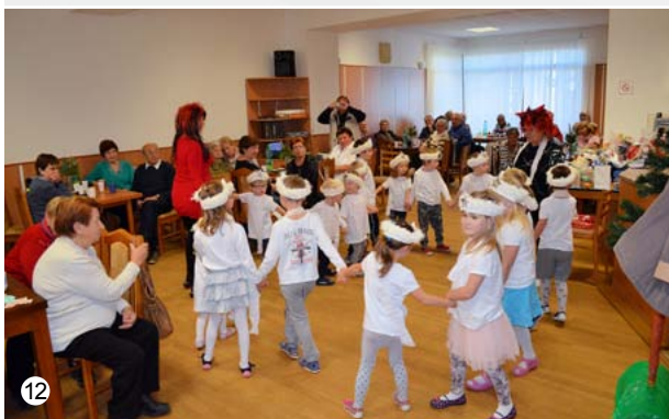
Mikulášská besídka STP