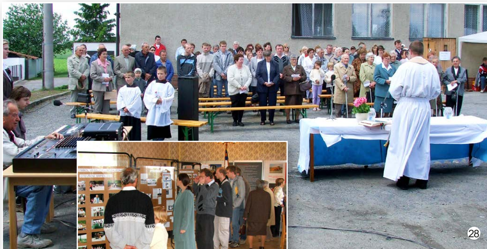
V roce 2006