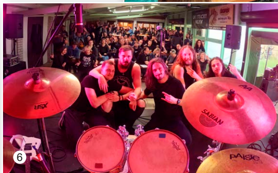
Metal pod Plechem ve Vavřinci