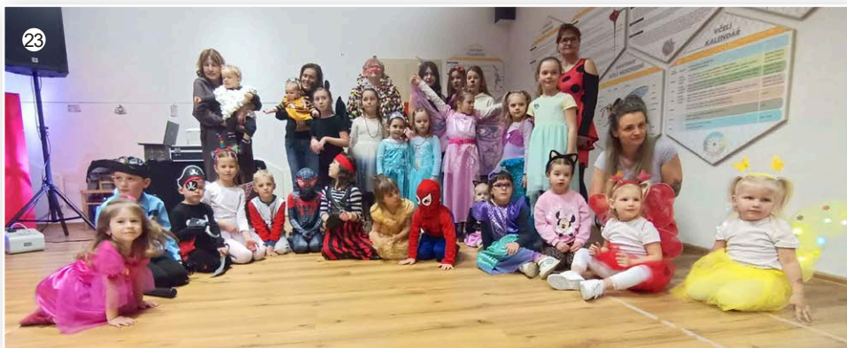
Karneval ve Veselici