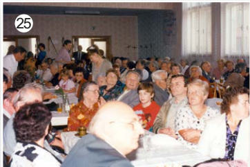
V roce 1996