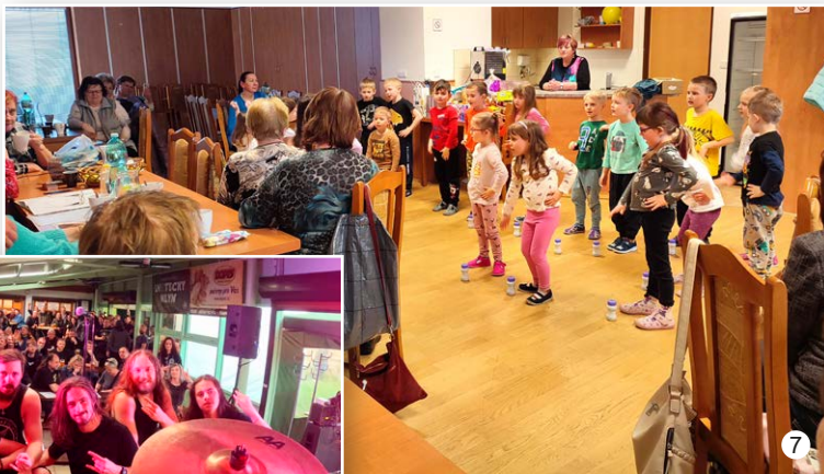
Zelený čtvrtek Pod plechem ve Vavřinci