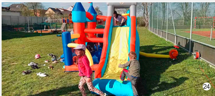
Zakončení sběru odpadků v okolí Veselice