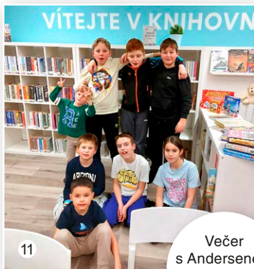
Večer s Andersenem v knihovně v Suchdole