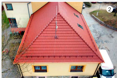
Rekonstrukce střechy ObÚ Vavřinec