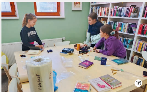
Workshop obalování knih v knihovně ve Vavřinci