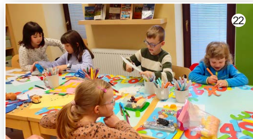
Dětská knihovna ve Veselice