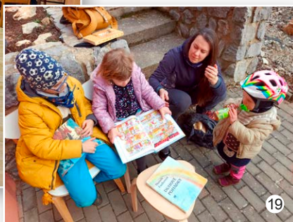
Akce knihovny Vavřinec Je nás slyšet