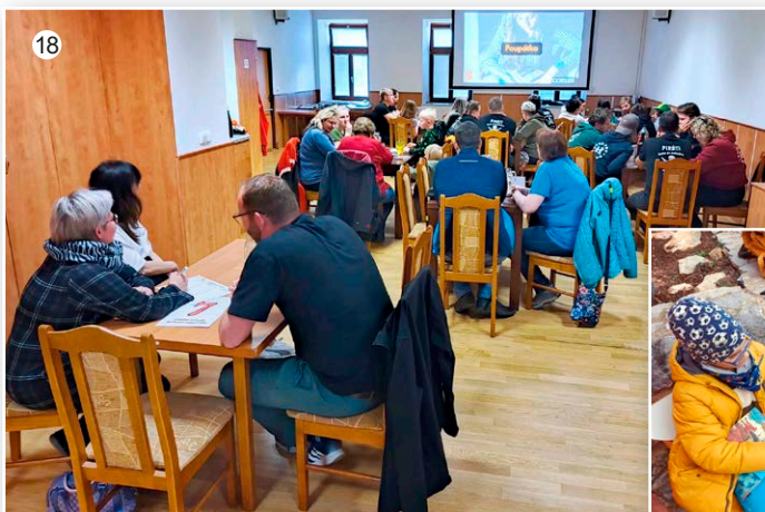
Dubnový kvíz ve Vavřinci