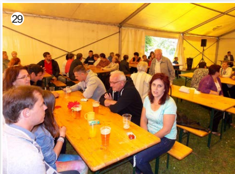
V roce 2016