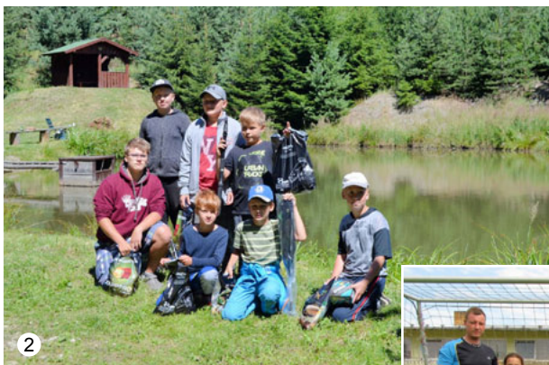
Dětské rybářské závody