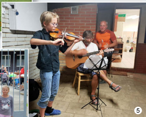
Sousedské popout'ové posezení ve Vavřinci