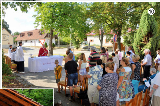
Mše svatá v Suchdole