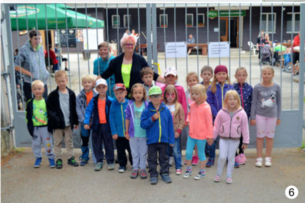
Zakončení školního roku ve Veselici